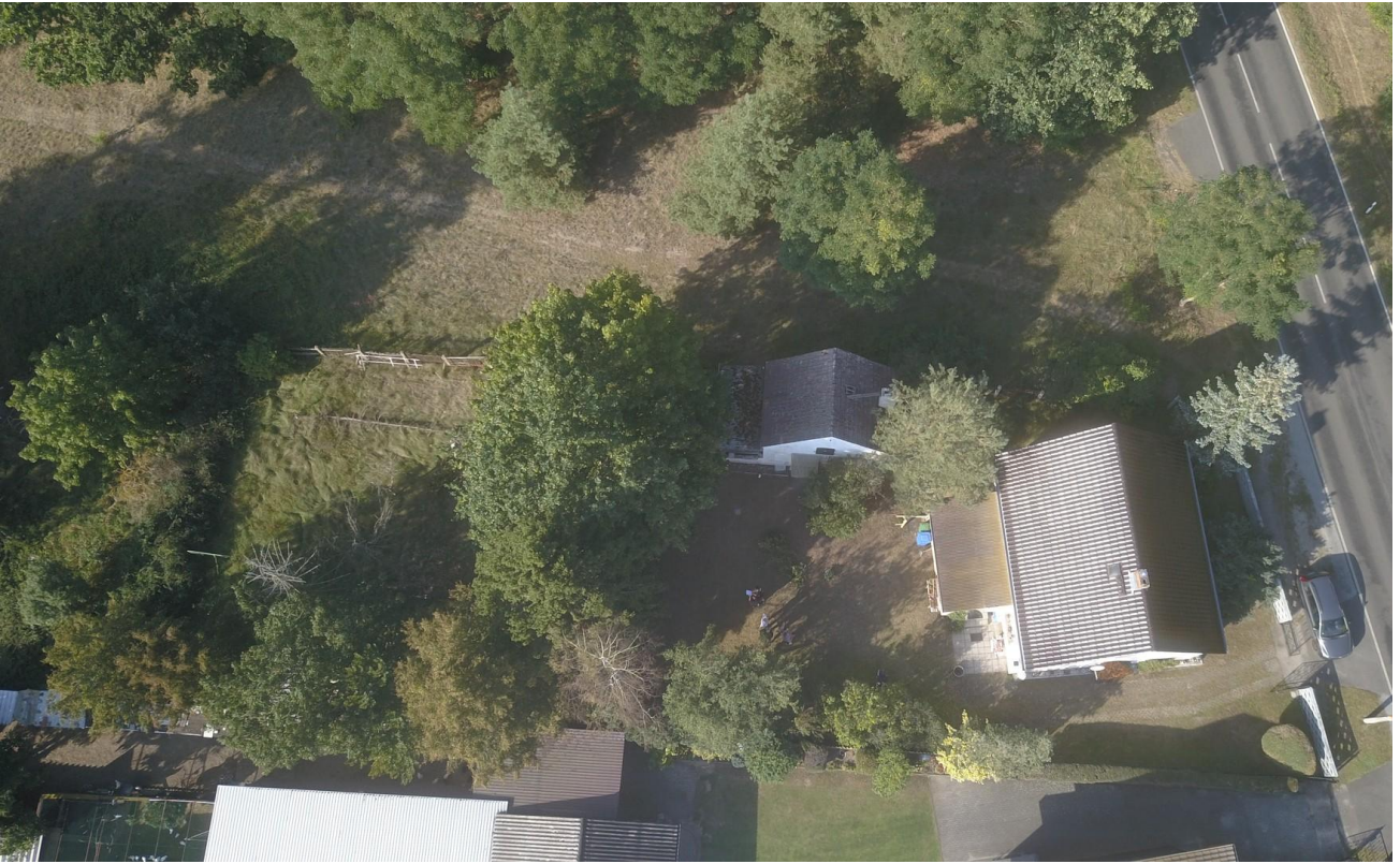
Blick von oben