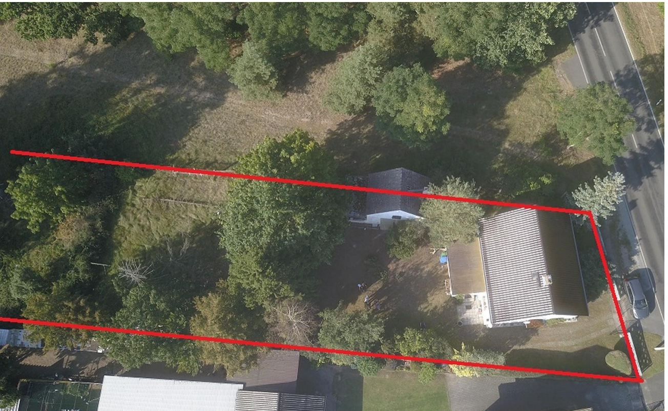
Grundstück von oben