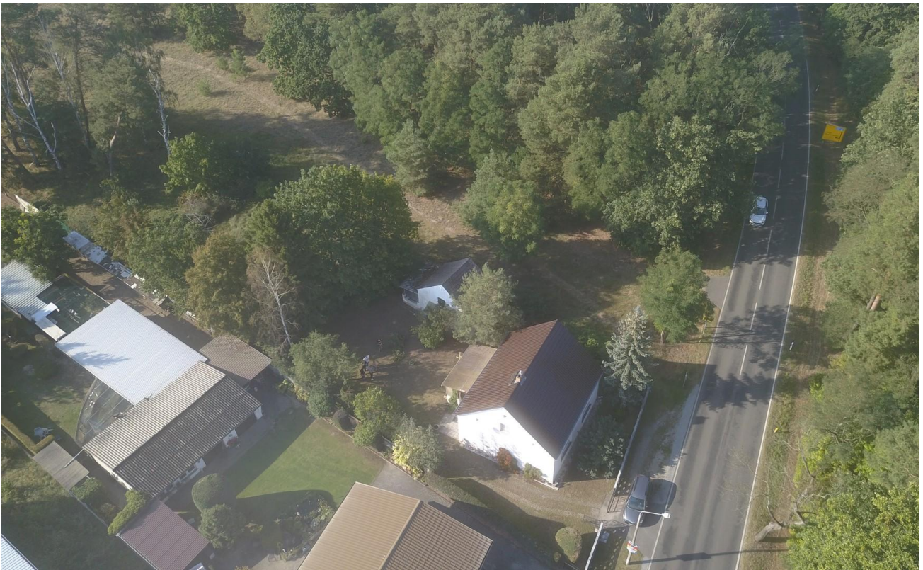
Blick Richtung Dannenreich