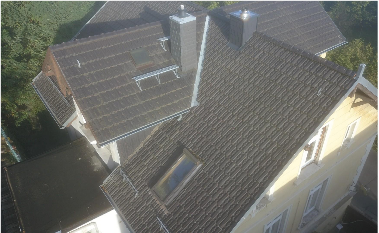
Blick auf das Dach