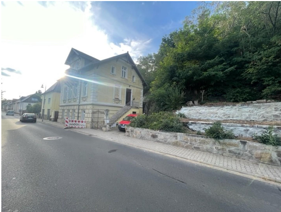
Blick in die Straße